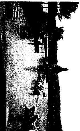
Bootspartie auf den Teichen bei Achterberg im Hintergrund ein Pavillon